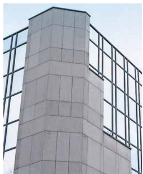
Eigentlich sollte der Gemeinderat über die Umgestaltung der Fassade befinden, doch dazu kam es nicht.

an-Areals demnach nicht verhindern, das Verfahren für den vorhabenbezogenen Bebauungsplan wurde eingeleitet.