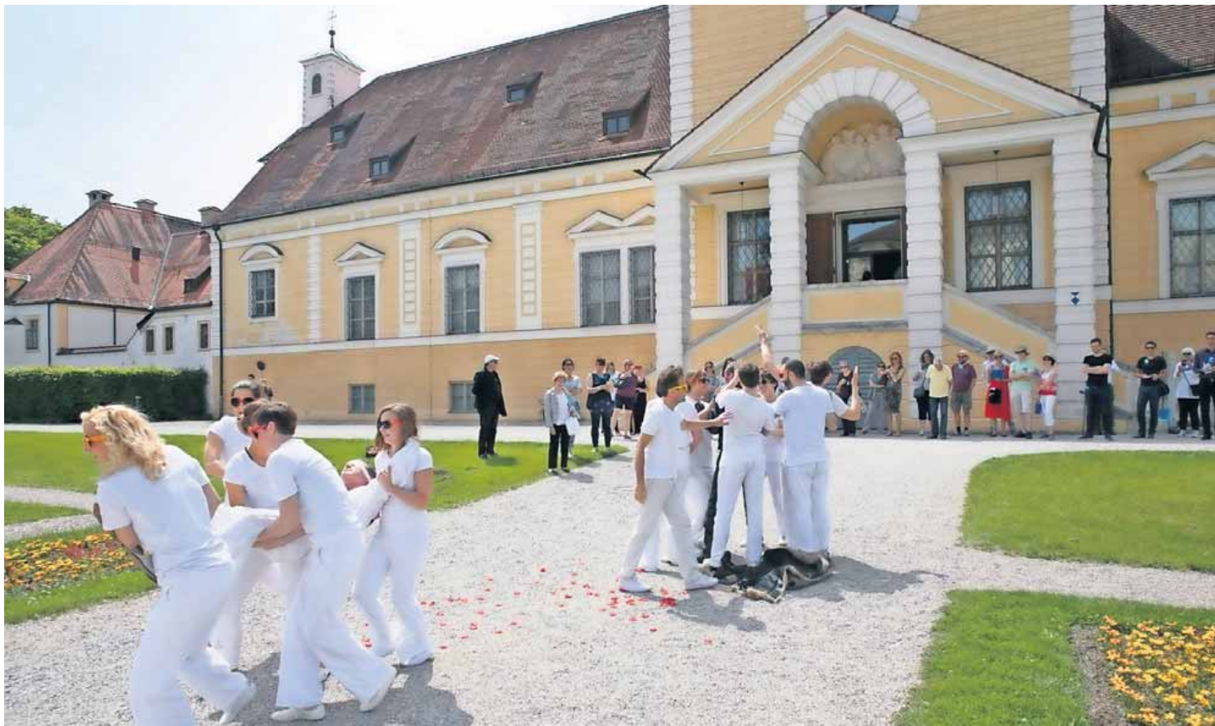
Zu Beginn des Stücks entführen die weiß gewandeten Engel Faust noch in den Himmel, doch Mephisto holt sich den geliebten Antagonisten wieder.

Als weiteres Serviceangebot verleiht die Stadt außerdem ein Lastenrad. Dieses Angebot war ein Wunsch aus dem Bürgerhaushalt.